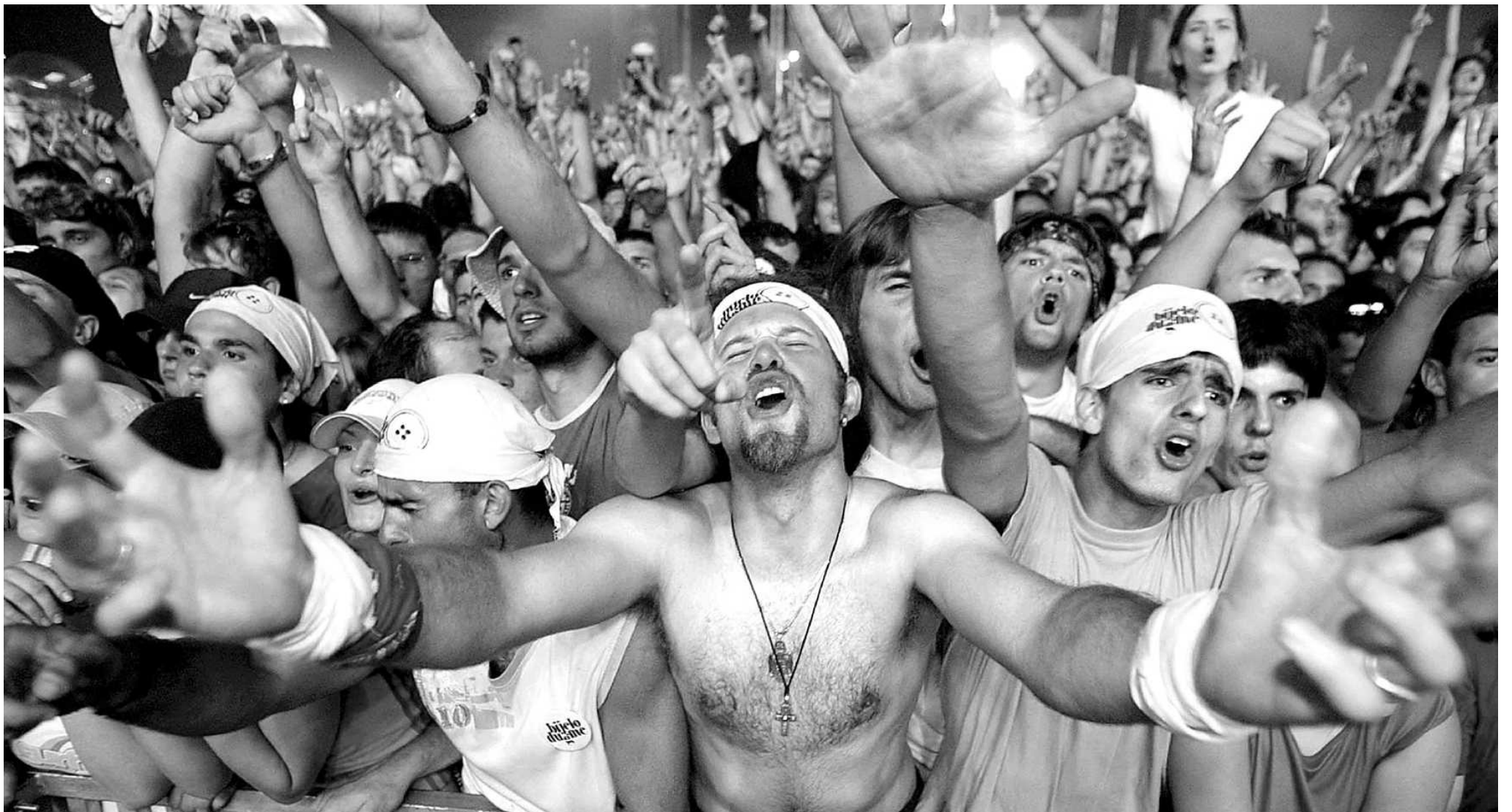
Fans van rockband Bijelo Dugme tijdens het concert van afgelopen dinsdag in Belgrado